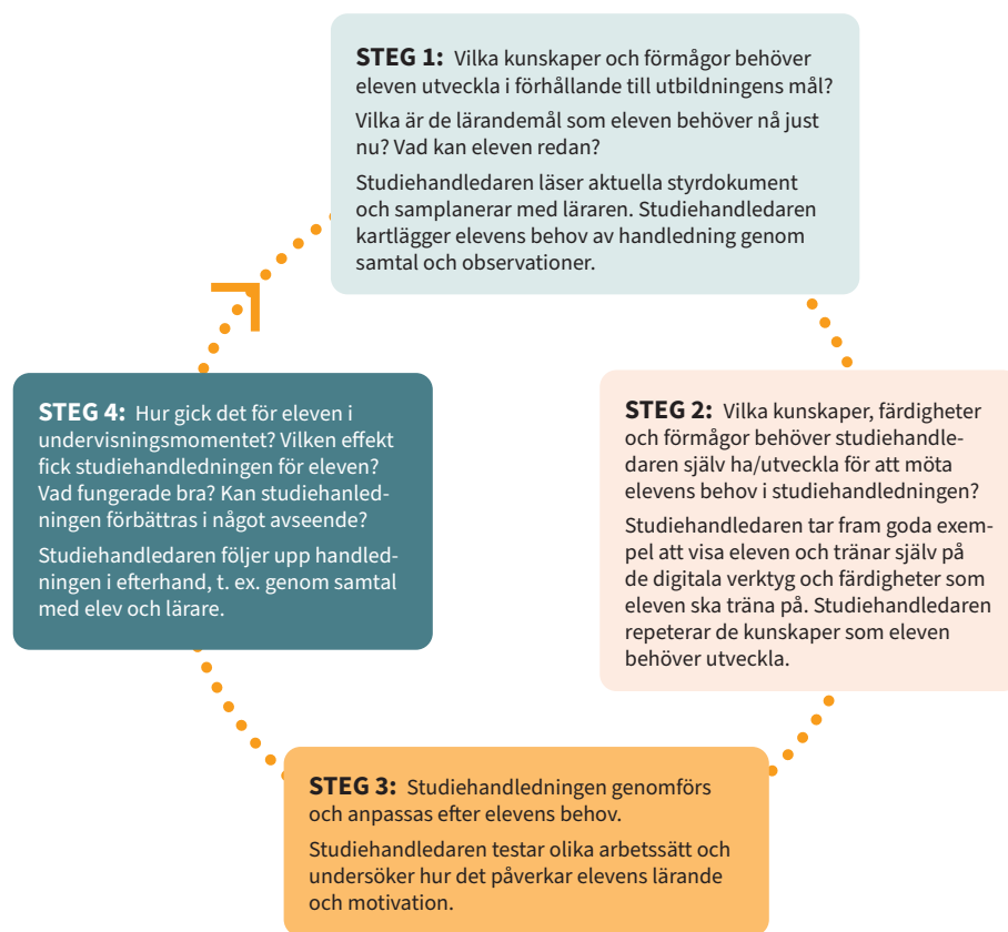
Figur 1. Modell för behovsanpassad och utvärderande studiehandledning