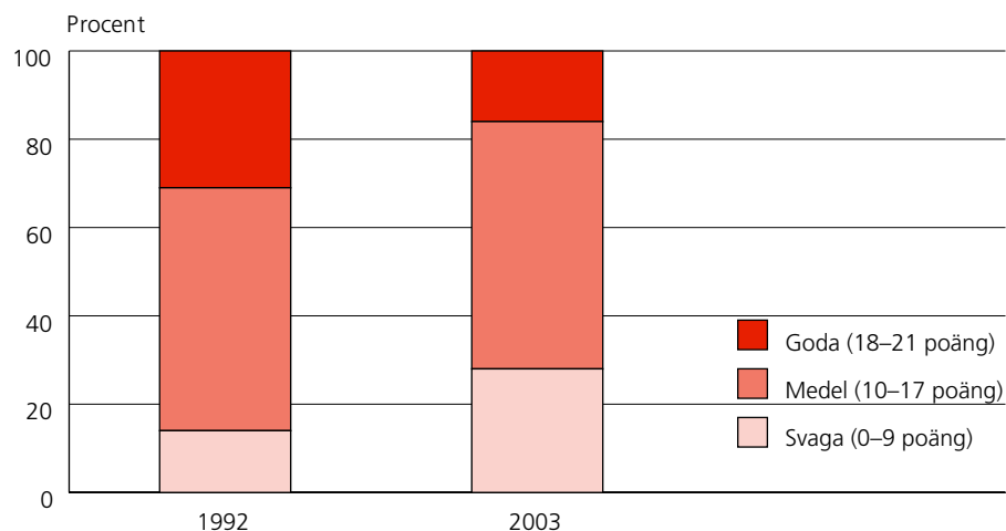
Diagram 1 Elevresultat 1992 och 2003 på samma prov. Procentuell fördelning.

eleverna förutom att kunna tolka och sammanställa data även, ” analysera och värdera data”.