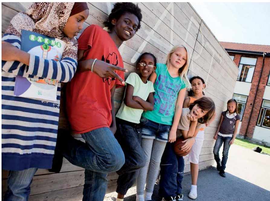
Att flerspråkighet är en tillgång både för individen och för samhället lyfts i Skolverkets bok Greppa språket .

Det rör sig inte sällan om elever som är