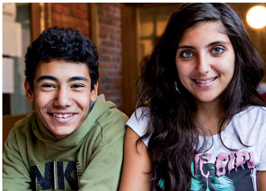
En nyhet för skolvärlden är att betyg ska sättas även i årskurserna 6 och 7.

TEXT: AURI ANDERSSON