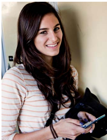
Ny bok, Gymnasieskola 2011, ger en helhetsbild av den nya gymnasieskolan.

Boken Gymnasieskola 2011 vänder sig till alla som arbetar inom gymnasieskolan. Boken publiceras lagom till skolornas planeringsdagar med syfte att ge en god förståelse av gymnasieskola 2011.