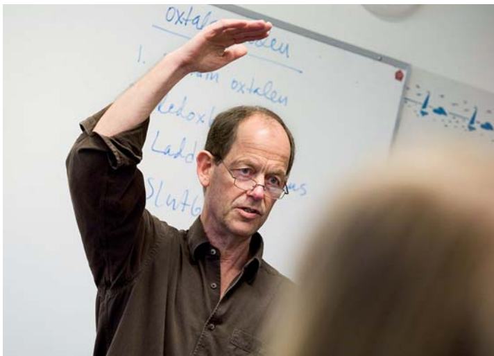
Under en period kommer två system att överlappa varandra, därför behövs det övergångsbestämmelser.

– Gymnasiesärskolans program har hittills inte genomgått en så stor förändring som de i gymnasieskolan, men förslag på