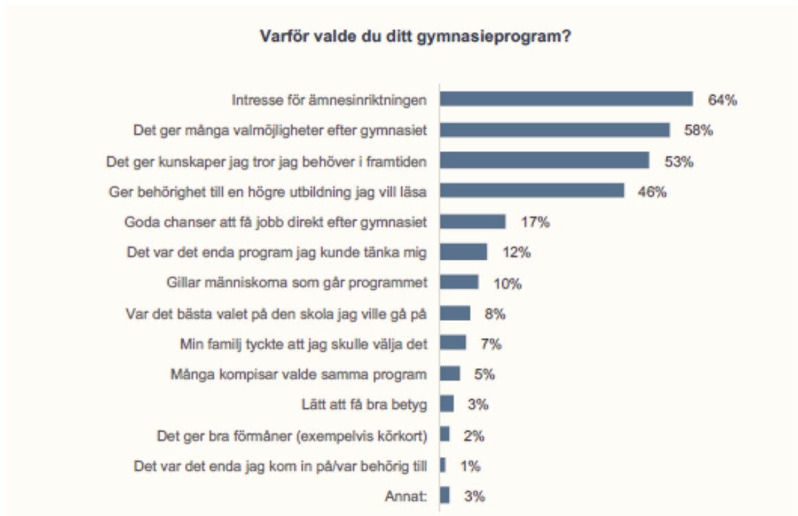
Figur 1. Varför valde du ditt nuvarande gymnasieprogram?