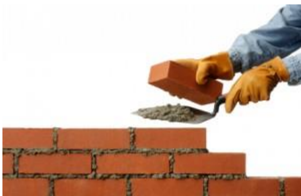
Figur 4. Ordförrådet sett som tegelstenar och murbruk

”Tegelstenarna” utgörs av de centrala ämnesorden som är kärnan i en text 1 om ett ämne. När vi till exempel studerar däggdjuren med fokus på de som lever vilt i Sverige omfattar tegelstensorden bland annat: björn, varg, lo, älg, rådjur och räv. ”Murbruket” är de allmänna nyttoord som gör att vi kan formulera vår kunskap om däggdjuren i fraser, satser och meningar. Murbruksorden kopplar samman och förstärker de ämnesspecifika tegelstensorden. Ofta hör de till basen i ordförrådet och utvecklas under barndomen. För andraspråksinläraren, särskilt den som är ny i svenska språket, kan murbruksorden vara obekanta och behöver undervisas explicit, kopplade till tegelstensorden. Murbruksorden utgörs framför allt av: