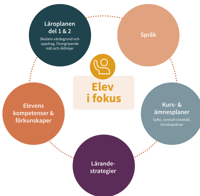
Figur 3. Fem fokus i studiehandledning på modersmålet

Här presenteras modellens tredje del, fem fokus inom studiehandledning. Studiehandledning på modersmålet ska syfta till att ge eleven förutsättningar för att nå de kunskapskrav som minst ska uppnås. 27 I den tredje delen av modellen för studiehandledningen på modersmål beskrivs hur studiehandledaren kan arbeta med fem fokus under studiehandledningspasset för att stödja eleven mot högre måluppfyllelse. I modellen betonas: 1) språk 2) kurs- och ämnesplaner 3) lärandestrategier 4) elevens kompetenser och förkunskaper samt 5) läroplanen del 1 och 2 , som studiehandledaren och eleven kan arbeta med under studiehandledningspassen. Studiehandledaren kan välja att beröra alla eller bara några av de fem olika fokusområdena under det pedagogiska samtalet, beroende på vilket ämnesinnehåll som ska bearbetas och på elevens behov. Målet för studiehandledningen på modersmål är alltid att ge just det stöd som varje enskild elev behöver (se figur 3).