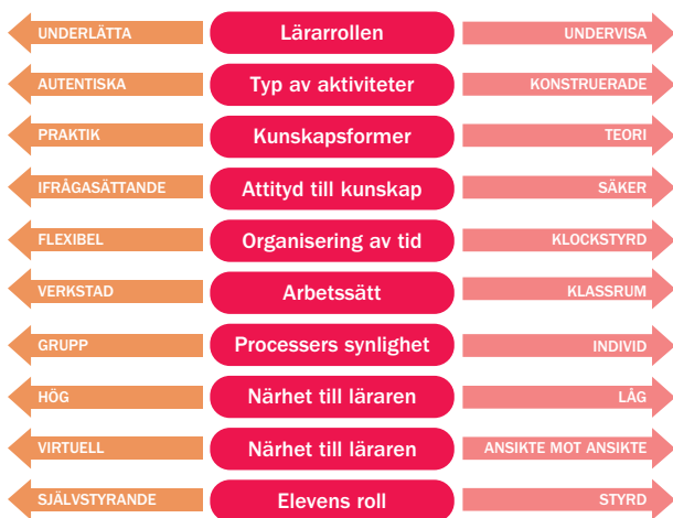
Figur 4. Tio dimensioner av beslutsfattandet i yrkesutbildning, min översättning (se Lucas, s. 10).

Slutligen sammanfattar Lucas tio dimensioner som beskriver det komplexa beslutsfattande som yrkesdidaktiken innebär för en lärare (se figur 4). Det handlar om de vägval som läraren både kan och behöver göra i sin undervisning – dock inte i betydelsen att ställa sig på den ena eller den andra sidan, utan att läraren kan behöva förflytta sig och placera sig någonstans längs den skala som finns i varje dimension (där pilarna i figur 4 pekar mot respektive ände av varje dimension).