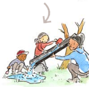
ILLUSTRATION: TOBIAS FLYGAR