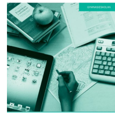
Läroplan för gymnasieskolan 2011, examensmål och gymnasie- gemensamma ämnen