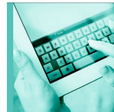
Läroplan för gymnasieskolan 2013

Var och en som verkar inom skolan ska också främja aktning för varje människas egenvärde och respekt för vår gemensamma miljö.