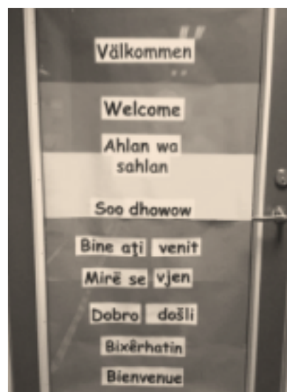
Välkomstdörr i förskoleklass.

Föräldrarna blir alltid glada när de ser ordet välkommen , och det skapar en god kontakt redan från första början. När barnen går in i klassrummet står alltid läraren i dörren och hälsar på barnen genom att ta i hand, säga deras namn och god dag på elevernas förstaspråk. Nu är det inte så lätt för läraren att hålla reda på vad god dag heter på alla språk i klassen, i alla fall inte till en början, men barnen får säga god dag först och sedan svarar läraren med samma ord. På det här viset bekräftar läraren barnens rätt att få tillhöra två kulturer med två språk genom att hon bejakar tilltalet på deras förstaspråk innan de går in i ett klassrum som under större delen av dagen är präglad av svenskt språk och svensk kultur.