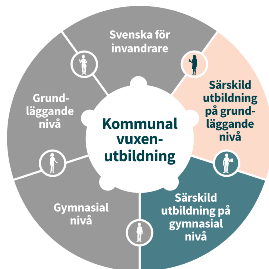
Figur 1 Komvux samtliga skolformsdelar

Dessa förändringar behandlas i ett särskilt beredningsuppdrag som till vissa delar har starka beröringspunkter med detta uppdrag, bland annat att Skolverket ska stödja kommunerna i sitt uppdrag att möjliggöra för målgruppen för denna skolformsdel att ta del av det större utbudet av utbildningar och andra resurser som finns inom kommunal vuxenutbildning. 8