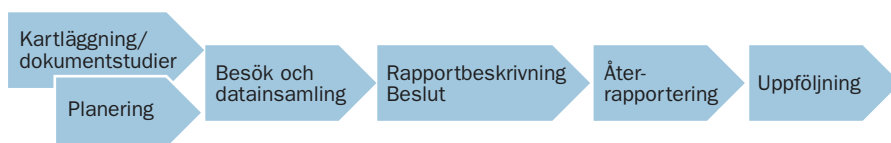
Figur 1. Utbildningsinspektion – huvudsteg i processen

I en första fas görs en kartläggning av de kommunala och fristående verksamheter som varje inspektionsperiod omfattar. Besök och intervjuer genomförs därefter. Insamlat utredningsmaterial analyseras, huvudmannen ges tillfälle att