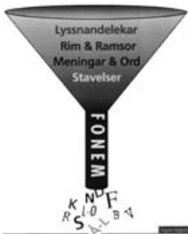
FIGUR 1. Schematisk bild av Bornholmsmodellen.

när trattens pip där de abstrakta svåråtkomliga fonemen finns. Slutmålet är att barnen ska behärska att lyssna efter första fonem i ord och även kunna identifiera det. Efter det att alla språklekar runnit igenom tratten, för att fortsätta med trattmetaforen, behärskar många av barnen att både göra en enklare analys av två- och treljudsord och dela upp orden i fonem (segmentera) och även föra samman fonemen till ett ord (syntes). Figur 1 visar Bornholmsmodellens trattmetafor.