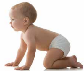
فرزندان پدر و مادرانی که تحصیل و یا کار میکنند