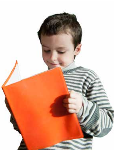
پیش دبستانی ۶-۷ ساله ها رایگان است