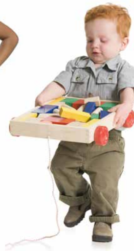
همه کودکان حدوداً سه ساعت در روز (کودکستان عمومی)