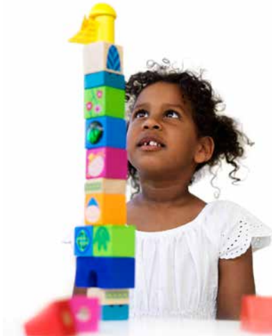
کودکستان عمومی ۳-۶ ساله ها رایگان است (سه ساعت)