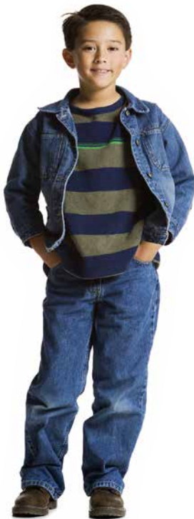
مدرسه "واقعی" شروع میشود