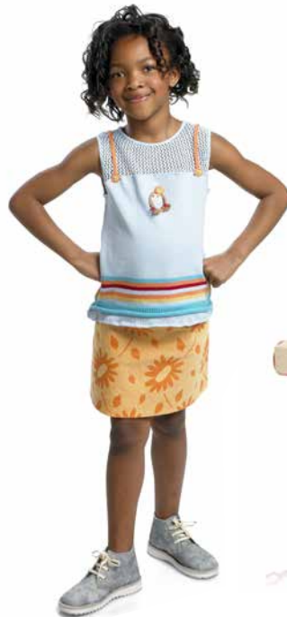
همه کودکان (کلاسهای پیش دبستانی)