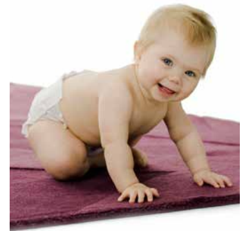
برای کودکستان ۱-۶ سال کمون نرخ آن را تعیین میکند