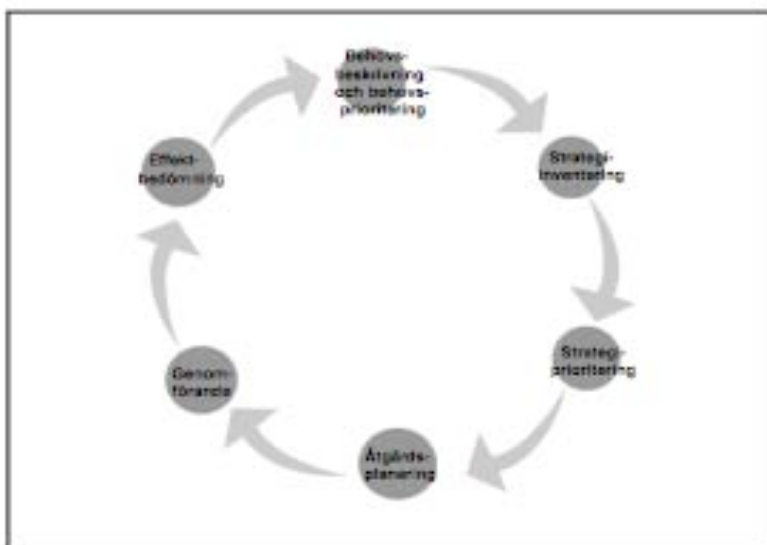
Figur 1. Förbättringsarbetets faser (Myndigheten för skolutveckling, 2003)