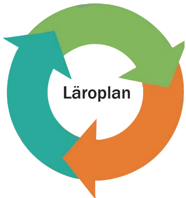
Hur gör vi?