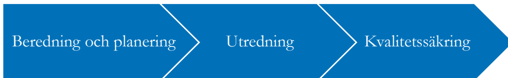
Figur 1. Schematisk beskrivning av Skolverkets arbetsprocess i uppdraget

I detta kapitel redovisar Skolverket huvuddragen i utredningens arbetsprocess. Utredningen har genomförts i en analysprocess i tre steg (se figur 1).