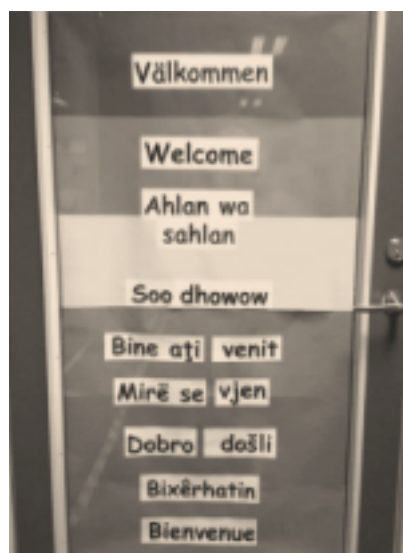
Välkomstdörr i förskoleklass.

Föräldrarna blir alltid glada när de ser ordet välkommen , och det skapar en god kontakt redan från första början. När barnen går in i klassrummet står alltid läraren i dörren och hälsar på barnen genom att ta i hand, säga deras namn och god dag på elevernas förstaspråk. Nu är det inte så lätt för läraren att hålla reda på vad god dag heter på alla språk i klassen, i alla fall inte till en början, men barnen får säga god dag först och sedan svarar läraren med samma ord. På det här viset bekräftar läraren barnens rätt att få tillhöra två kulturer med två språk genom att hon bejakar tilltalet på deras förstaspråk innan de går in i ett klassrum som under större delen av dagen är präglad av svenskt språk och svensk kultur.