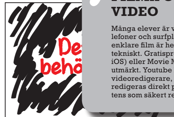
Textövergång. Cirka fyra sekunder.