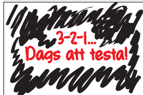
Textövergång. Cirka fyra sekunder.

Ljudeffekt: Stubinröd som brinner (ligger kvar till nästa bild).