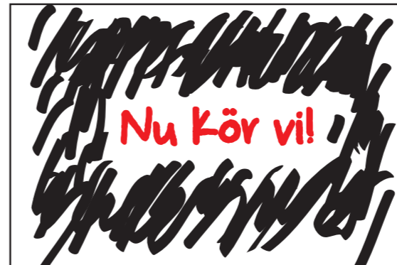
Textövergång. Cirka fyra sekunder.

Berättarröst (Stella): Du behöver också en skål att blanda i, en stor sked och en bit plastfolie.