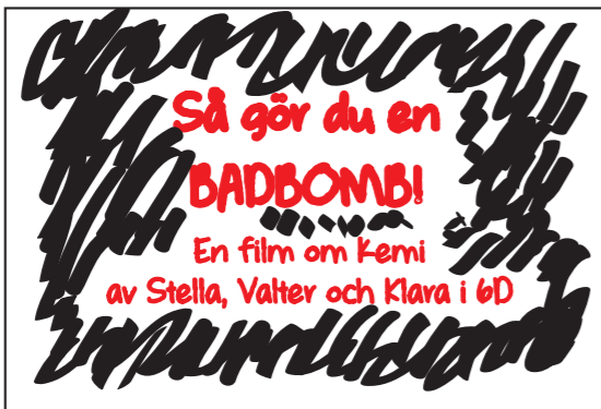
Titel på svart bakgrund. Cirka sju sekunder.

Ljudeffekt (om vi kan hitta det): En stubinröd som brinner.