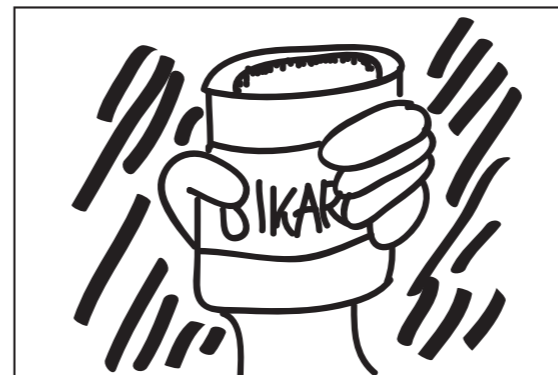
Närbild på bikarbonatburken. Valter i bakgrunden.

Valter säger: "... hittar du i en vanlig mataffär!"