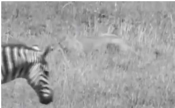
Bild 4 Ett lejon på lur i gräset sett genom en zebras ögon.

En annan faktor är att, om det ges möjlighet, jaga zebror. Zebran är ett lätt byte som ger stor utdelning för lejonerna. Då zebror ser i svartvitt kan lejonerna ta sig närmare utan att bli upptäckta (bild 4). När en grupp ska ge sig på ett större djur är ofta natten en lämplig tid för jakt, det ger både skydd och försämrar bytet syn vilket är en stor fördel för lejonerna.