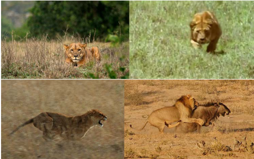
Bild 5. Lejonets rörelsemönster vid jakt.

Under jakt håller lejonet en mycket låg tyngdpunkt, för att det ska kunna komma så nära bytet som möjligt. Det ”hukar” sig mot marken och närmar sig till en början mycket sakta, nästan krypandes. Under hela processen hålls maximal uppsikt kring allt runtom genom lejonets skarpa sinnen (hörsel och syn). Lejonet kan om det behövs lägga sig ner och vänta i timmar på rätt byte utan att flytta sig en meter ( bild 5A ). När det har kommit tillräckligt nära bytesdjuret, runt 30 meter eller närmare, tar det sats (går ner mot marken och gör sig redo att spurta iväg med hjälp av sina muskulösa bakben)( bild 5B ) och sätter av i full fart ( bild 5C ) och går till attack i full fart ( bild 5D )