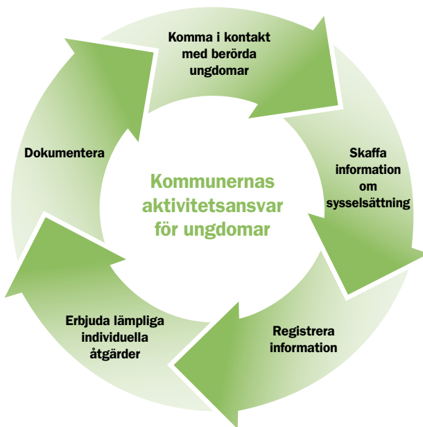
Fig. 1 Kommunernas aktivitetsansvar för ungdomar löper under hela året.

Enligt skollagen ska en hemkommun löpande under året hålla sig informerad om hur de ungdomar i kommunen är sysselsatta som har fullgjort sin skolplikt, men inte har fyllt 20 år och inte genomfört eller har fullföljt utbildning på nationella program i gymnasieskola eller gymnasiesärskola eller motsvarande utbildning. 17 Förarbetena pekar på att tillägget ”under året” i 29 kap. 9 § skollagen, förtydligar kommunernas ansvar att samla information, kontakta ungdomar och erbjuda insatser, och att detta ska genomföras under hela året . Enligt samma förarbeten omfattar kommunernas aktiviteter i förhållande till målgruppen, allt från kartläggning och uppsökande verksamhet för att hitta de berörda ungdomarna, till olika insatser för att i första hand motivera ungdomar att påbörja eller återuppta en utbildning. 18