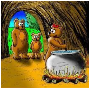
Forget about the porridge, I made Goldilocks stew

Ex: (Allmän)mänskliga djurfamiljer i fiktionen?